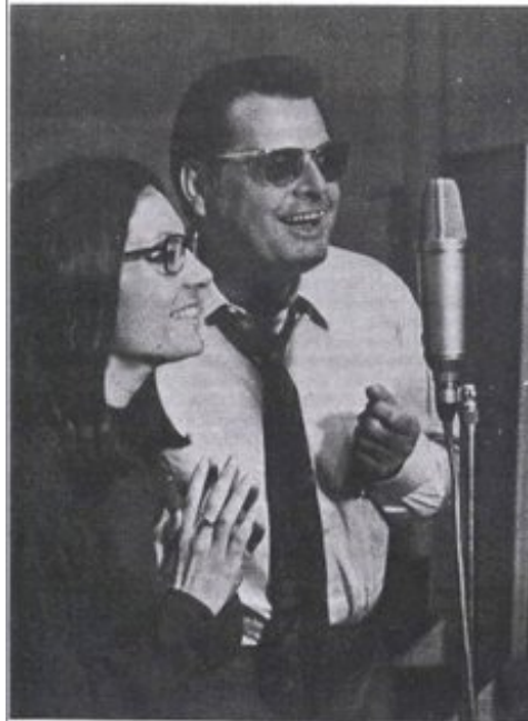
Nana Mouskouri und Gerhard Wendland

Diese STEREO-Schallplatte ist mit jedem modernen Leicht-Tonabnehmer abspielbar. Der ST